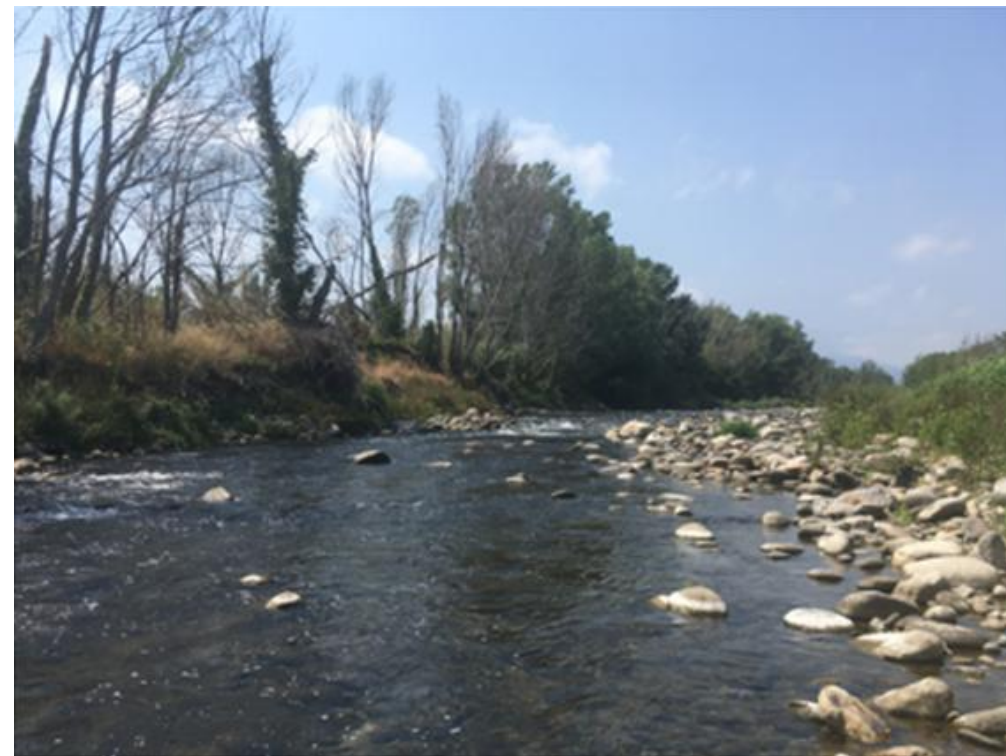
Station de la Têt à Ille sur Têt @hydrogeosphere

Retrouver toutes les infos concernant les mesures sur le site de la préfecture des Pyrénées Orientales/ Préservation de la ressource.